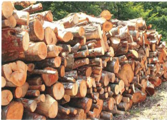
パルプや燃料にしてしまうには勿体ない宝の山

「お椀から建物まで」「百年かかって育った木は、百年使えるものに」「子ども一人、ドングリ一粒」