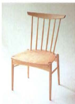
小径木のみなかみ材を随所に用いたMori:to（モリート（mori+hito））チェア

小径木や曲がり材など規格外広葉樹の活用プロジェクト・Neo Woods（岐阜県本巣市の有限会社根尾開発、岐阜県高山市の株式会社カネモクとの協働で行っている）を皮切りに、連携協定を結ぶ群馬県みなかみ町とは、伐り出した広葉樹をほぼ全量買い取ることで、自伐林業家の経営の安定化にも寄与しています。他にも、新たな取り組みが、目下進行中です。